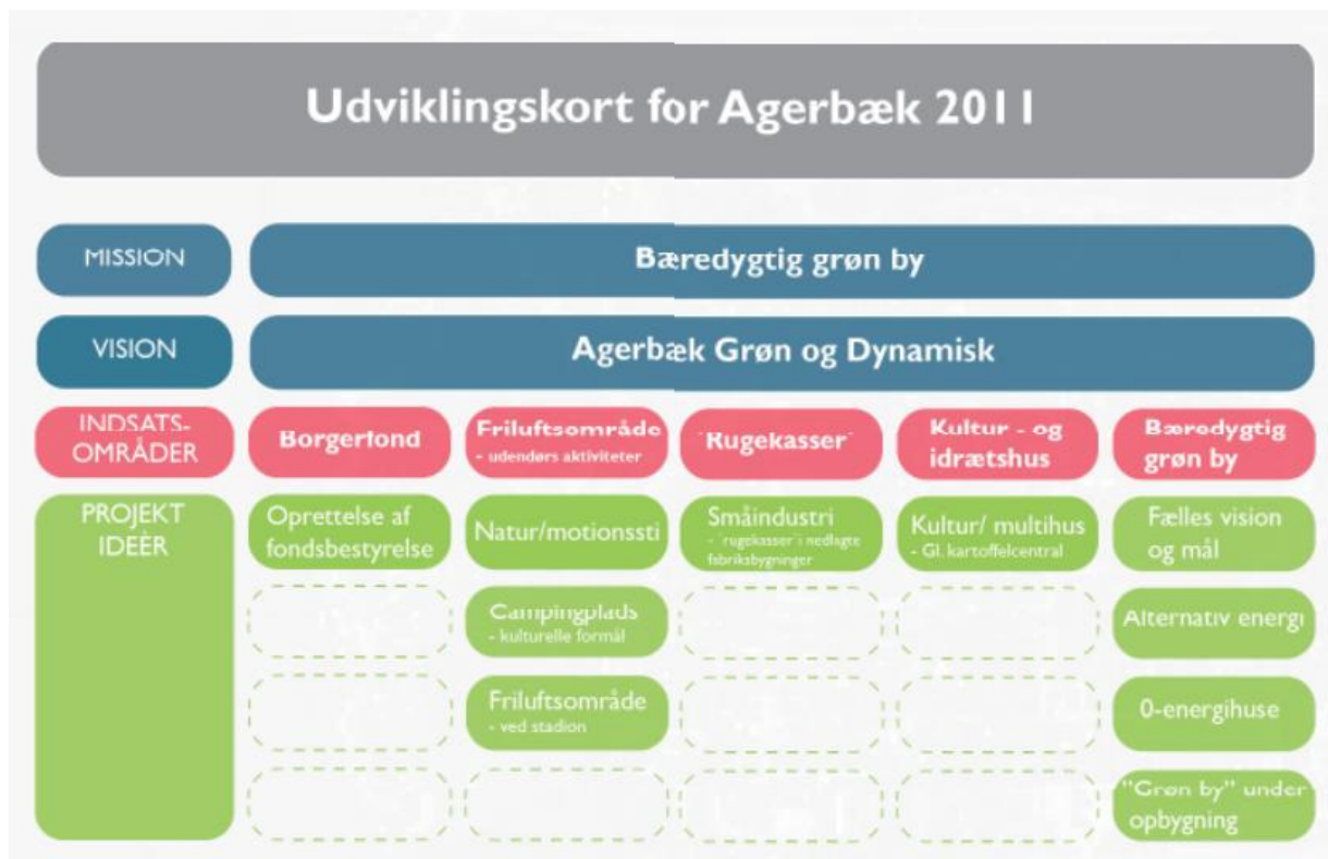
Udviklingskort for Agerbæk

Som det fremgår af udviklingskortet for Agerbæk er der fem indsatsområder med forskellige projektideer. En del af projektideerne indenfor indsatsområderne friluftsområde, rugekasse, kultur- og idrætshus og bæredygtig grøn by kan få indflydelse på kommuneplanen afhængigt af, hvordan og hvor de planlægges gennemført.